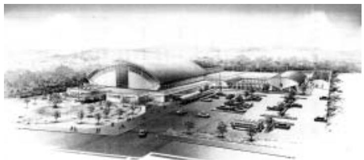
●猿投公園体育館&弓道場イメージイラスト