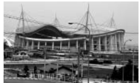
●全開状態の豊田スタジアム