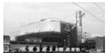
●8月から試運転に入る豊橋市のキルン式ガス化溶融炉方式の清掃工場