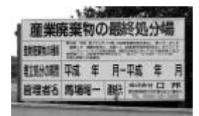
宮川興業の事業を引き継いだ日邦

答弁 今後も環境省の通達に基づく他の自治体との協議は行わざるを得ないと考えるが、豊田市または他の自治体において、生活環境の保全上の支障や市民生活への影響などを考慮して、市として最善の判断をしていきたい。