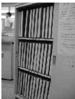
市民の情報が流出している住民基本台帳

答弁 「閲覧」は、住民基本台帳法で認められた権利であり、その権利を否定するような考えは持っていない。このような条例は法律に抵触する恐れもあると考える。地方自治法第14条にあるように、条例は、地方公共団体の事務に関して、法令に違反しない限り、制定できると理解している。