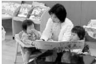
「病児保育室 すくすくの森」での保育風景