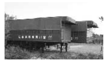
豊橋市の宮川興業の処分場

豊田市成合町で産業廃棄物最終処分場を経営していた宮川興業(株)が、昨年9月、豊橋市内に設置している産廃最終処分場の汚水を処理せず放流して、「廃棄物処理法」違反で、同社の役員ら2名が逮捕された。報道によると、豊田市や田原市の施設から、豊橋市にある同社施設に搬入した汚泥水、約345kℓを浄化処理をせず、違法に設置したパイプを使い、近くの川に流し、汚泥水は、約500m下流の太平洋まで流れ出していた。この逮捕を受け、宮川興業は御船町での産廃最終処分場の設置計画を取下げ、また、本市も本年1月5日、宮川興業に対して産廃の処理業および収集運搬業の許可を取消した。私は、数年前から豊橋市内の市民グループや豊橋市議と連携し、この不適切な汚泥水処理を市当局に指摘してきたが、「豊橋市内では問題がない。優良企業である」という見解で他人事として市はまったく取合わなかった。この数年間のたれ流しを消すことはできないが、不適正事業者の営業許可が取消されたことは良かった。