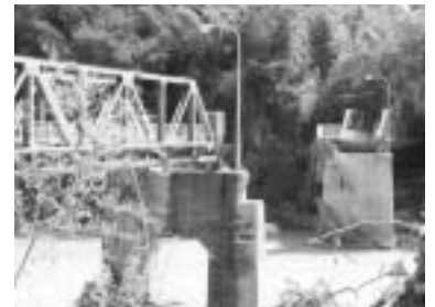
●早急の復旧が待たれる富国橋

また、防災無線が、全く機能していなかったり、地元CATVが、必要な情報をタイムリーに流さなかった等の指摘もあります。こうした失敗を二度と繰り返さないためにも市役所内では、十分に対策を練らなければなりません。そのためにも我々議員がしっかり行政を監視し、何でも賛成の議員になるのではなく、時には、厳しく指摘できる議員になるべくこれからも頑張っております。なお、市では、被災者の相談窓口を豊田市役所南庁舎4階大会議室に設置致しました。被災住宅の復旧・融資、見舞金などの申請、税・年金の減免と罹災証明等についてお問合せください。また、私も議員としてできる限りの事をしてまいります。今回の市の災害支援制度だけでは、被災者の支援としては全く足りないとの声もあります。この点も踏まえご意見、ご質問等、お気軽にご相談ください。