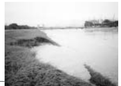
●矢作川から堤防を越えて浸水した御立町、豊田東高予定地付近。写真左側が矢作川本流