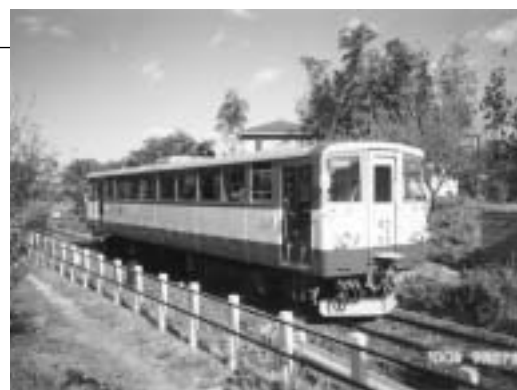
●三河御船駅を出るレールバス。この時の乗客は、3名程度だった。

◎(岡田)豊田スタジアムは、付帯施設を含める年間維持管理赤字が4億5,000万円と想定され、三河線存続は、交通弱者へのバリアフリー、福祉政策との考えから1億円の補てんで済むならいいのではないかとこの考えもあるが市として存続の分岐点はどこか。