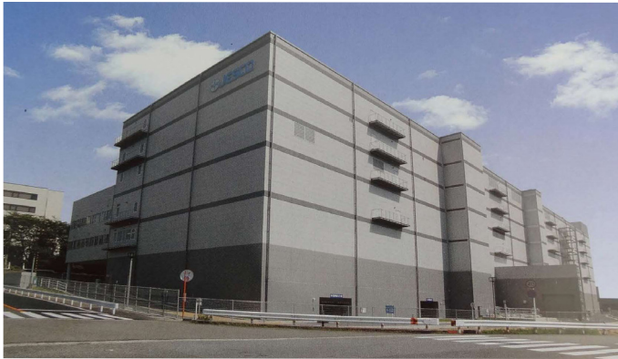
東海地区のPCB廃棄物を対象とした処理施設だったJESCO豊田事業所。当時、広域処理などが検討されていた。その後、稼働期間延長、他地区からの受入れが決定