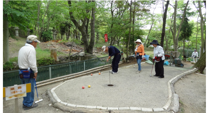
年々、増加するマレットゴルフ競技人口に対応する施設整備が急務である