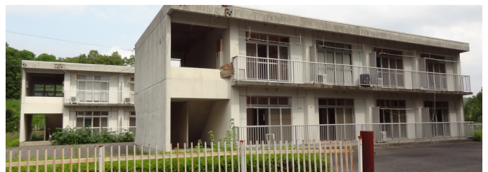
市営住宅不足解消のため、に廃止される教職員住宅の活用を求める