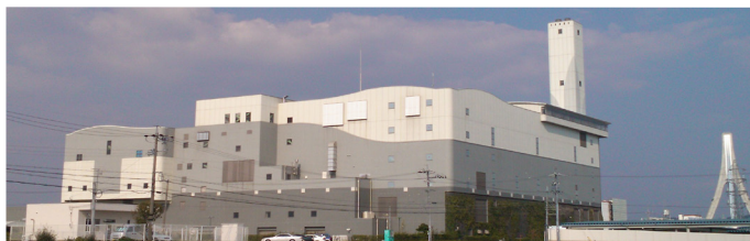
特定規模電気事業者(PPS)に売電している渡刈クリーンセンター