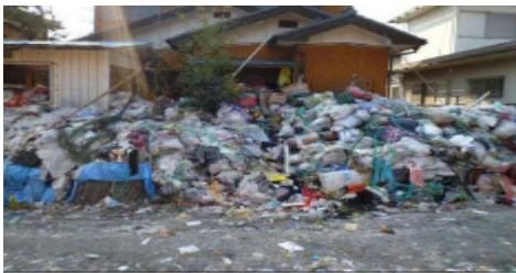
全国的にごみ屋敷の問題が増加。本市でも各地で見られる