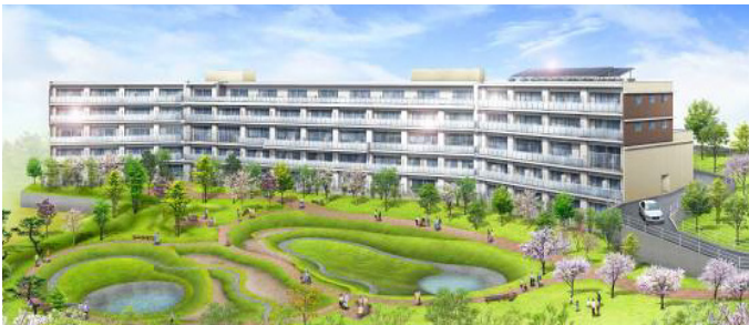
サービス付き高齢者向け住宅 T-グランシア水源