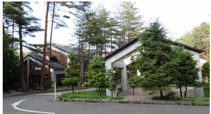
穂高温泉郷に設置されている市民山の家リゾート安曇野