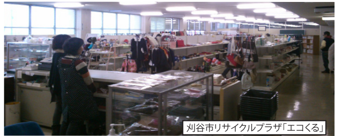
刈谷市リサイクルプラザ「エコくる」