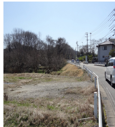
写真左が東部給食センター北側の宅地開発予定地。当時、隣接市道に歩道設置計画がなかったが、その後、歩道整備が決定