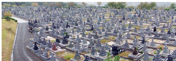
古瀬間墓園 3, 4区画