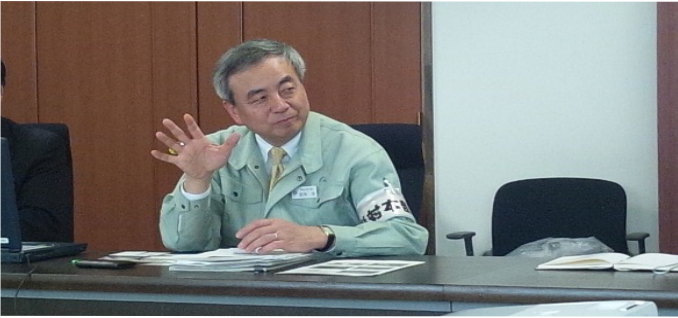
熱く思いを語られる菅原茂・気仙沼市長