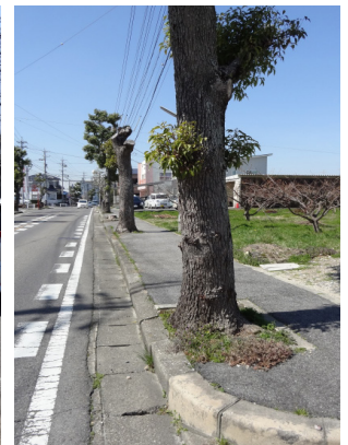
美里3丁目地内市道東部33号線。大木化し、枝払いされた街路樹。その後、歩道を含めた道路改修が決定