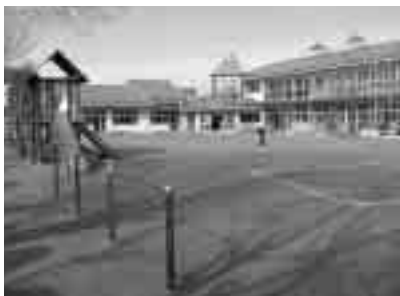
●平成18年移管予定の歴史ある市立野見幼稚園