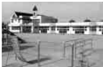
●低年齢児保育のみが移管された、みずほ保育園

● アンケート結果をもとに2回にわたり、話し合いを実施。来年度の移管に向け、法人職員も調査当時表情が硬かったかもしれない。現在は、「心に伝わる元気なあいさつ、子どもも保護者も安心できる笑顔、1人1人の気持ちにそった保育に心がける」と毎朝唱和し、仕事に入っている。また、ビデオ便りや「成長の記録」と題した保護者との連絡便りで情報交換に努めている。おかげで多くの保護者から感謝の声も伝わっている。