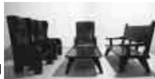
●拭漆櫛家具セット