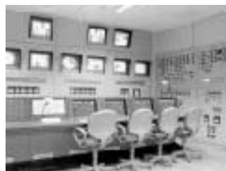
■制御室。運転管理はメーカー職員の予定

これに対して、「見積設計図書におけるメーカー提案の工場の運転に必要な人員は33名であるが、今後、実施設計を行っていく過程で、運転人員調書および運転管理委託調書により、委託人員と市の職員で、適切な人員配置を検討していく。年間の委託費については未定である。今後検討結果により、運転人員の変更あり、それに伴う必要な委託費については、市が負担する。委託費については、今後の市の委託人件費等の推移を参考に、積算していきたい。運転管理業務委託は、施設整備を進める中で明らかにしていきたい。」とおかだ議員が危惧していることに対して何一つ答えられない状況が分かった。