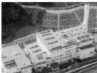
■日立造船製の桜井市新清掃工場

まずはじめにおかだ議員は、「予定価格税抜きで約176億円のところ104億2000万円で日立造船を代表とするJVが落札した。予定価格と落札価格があまりにかけ離れているが、予定価格の設定と落札価格の妥当性をどう考えるのか。日立造船製の施設としては、福江市(29t×2炉)、桜井市(75t×2炉)が、稼働しているが、豊田市として他の施設の稼働データをどのくらい把握し、実績をどのように評価するのか。」と質問した。