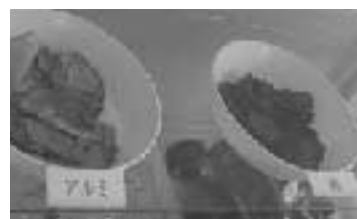
■お金を払って引き取ってもらっているアルミと鉄

れたスラグは、現在全量、大阪湾に埋め立て、鉄はトンあたり9000円、アルミもトンあたり3000円でお金を払って引き取ってもらっている。実態を知ると本当に売却できるのか疑問。鉄、アルミに