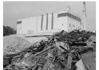
▲藤岡プラントにも粗大ごみ、生ごみの山が

◎先日環境部にお願いし、いただいた資料によると15年4月から12月までの渡刈、藤岡両プラントに搬入された市内の可燃ごみ量は前年、前々年の同時期に比べ増加し続けている。ごみ増加の要因をどう認識しているのか。また、その対策をどう考えているのか。