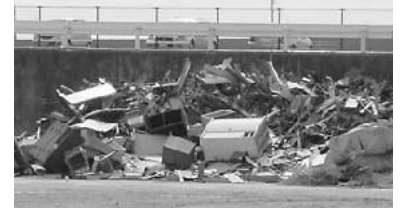
▲波刈清掃工場内のごみは未だ処理できず 4月3日現在

◎ごみ増加は全市民的な問題である。以前、名古屋市ではごみ非常事態宣言を行い、全市民に危機意識を持っていただくことによってごみの減量効果があった。豊田市でもごみ減量化に対する市民意識を高めるためにごみ増加非常事態宣言をすべきだと思が見解は。