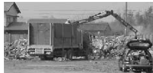
▲新工場予定地もごみの山 4月3日現在

▲清掃工場受け入れ時間については、16年4月1日から午前9時の搬入時間を従来の11時30分から12時まで延長して受け入れを行う。使いやすいごみ袋への変更は、15年5月から7月まで指定ごみ袋の大きさについて市政モニター、消費生活モニター、消費生活グループ、自治区長等へのアンケート調査を行った結果、「ちょうどいい」が84%であったことから大きさは変更しない。形状については今のままでよいが44%、縛り口付き31%、巾着型25%であったため、平成16年度に縛り口付き、巾着型の試行袋を作り、より広範な地域での試行とアンケート調査を行い、平成16年度中に検討する。