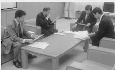
▲太田議長に対して申し入れを行う3人

おかだ耕一議員が所属する豊田市議会内会派「新政クラブ」の3人は、去る平成16年3月25日、太田之朗議長に対して地方自治法第100条の規定により議会内に「(仮)市議会不当要求