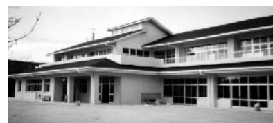
移管後、平芝幼稚園がひらしば幼稚園に名称変更

安定した保育を優先し、今後、事業開始に向けた準備を進めている。いずれにしても未就園児の重要な子育て支援策のひとつであり、早期実施に向けて協議していく。