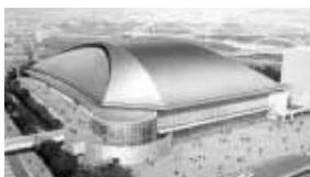
H19年4月オープン予定の総合体育館

質問 豊田スタジアムは名称を公募したことや広告企業との関係でネーミングライツ導入は困難と以前答弁された。総合体育館は、まだ、名称募集していない。正式名称は豊田市総合体育館とし、収益をあげられる可能性があるのなら、ぜひネーミングライツを導入し、愛称を企業に取得してもらう考えはないか。