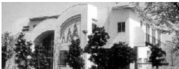
未だ専任の園長が決まらない青木幼稚園

質問 青木幼稚園では、5月に園長先生が退職されて以来、専任の園長不在で9月に入っても理事長が園長を兼任されている。移管法人募集要項では、園長は専任であることが謳われているが、この人事をどう認識しているのか。