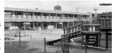
H20年度に民間移管予定の東丘幼稚園

質問 保護者から様々な意見があるなか、移管計画を見直すべきと考えるが、所見を。また、21年度から30年度までは幼稚園3園を移管する計画だが、見直しも含め、21年度以降の計画をどのように考えているのか。