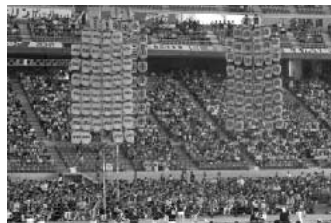
秋田の竿燈まつり

質問 計画と比較すると相当開きがある。チケット販売についても老人クラブや会社から、「無理やり買わされた」という声も多く聞く。チケットの販売方法や3日間開催に無理があったと思うが、どう思うか。