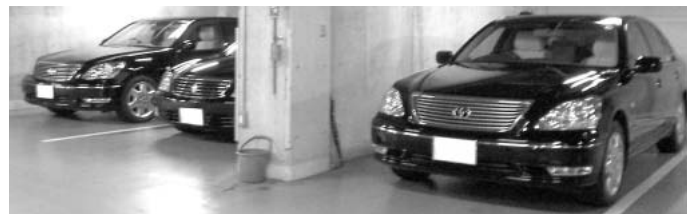
3年で更新される市長車、議長車

再質問 私は自動車販売店勤務の経験がある。車両価値は使用年数とともに走行距離を重視している。本市の過去5年間の車両更新実績を調べると10年以上の使用でも走行距離が3万km台、4万km台という車両が、ただ同然で下取りされていた。市場では黒塗り公用車は、非常に人気がある。16年には3年弱使用の市長車、議長車のセルシオ2台がセットで下取りされた。その価格は新車2台の値引き込みで698万円。私には販売店が儲かるように下取りされたと思える。より高く売却するという意識が感じられない。あるなら一般競争入札を実施すべきだ。