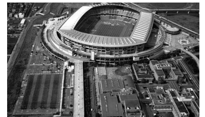
5年間、総額23億5千万円でネーミングライツ契約された日産スタジアム

委託費に維持管理費や修繕費、光熱水費を加え、収入を差し引いた市からの持ち出し額は約4億800万円である。横浜市は日産自動車と横浜国際総合競技場のネーミングライツ契約を結び、「日産スタジアム」と名称を変え、年間、4億7,000万円の収入を得ている。名古屋市でもレインボーホール等のネーミングライツ導入の報道もされた。全国各地にもフルキャストスタジアム宮城(仙台市・楽天イーグルス本拠地)、味の素スタジアム(東京・調布市・FC東京と東京ヴェルディ本拠地)等が、ネーミングライツされている。公募した名称を大事にする気持ちは大切だが、億単位の収益をあげられる可能性があるなら、ネーミングライツを導入し、市から(株)豊田スタジアムへの委託費用を見直すべきだ。