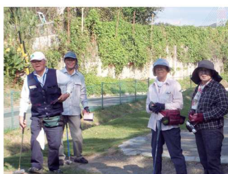
スコアがいいと笑顔がこぼれます?