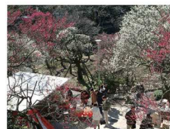
▲ 熱海梅園(イメージ)