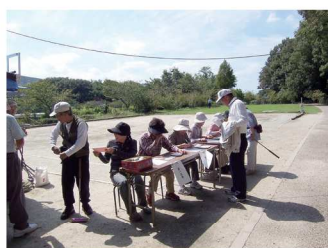
受付ありがとうございました