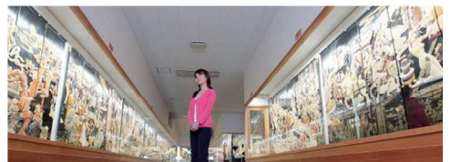
▲ 西伊豆・象牙美術宝庫(イメージ)