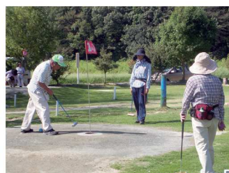
ナイスバーディー?