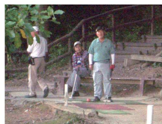
3人によるプレーオフ