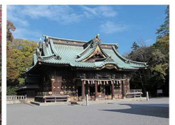
▲ 三嶋大社(イメージ)