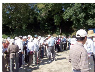
開会式が始まります