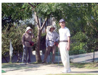
打ってもいいかな?