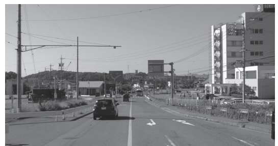
内環状線 野見小西交差点から竜宮橋方面を望む

野見小学校西交差点から下市場町5丁目交差点手前までの2,240mの4車線化を計画。国道301号と交差する野見小学校西交差点から、矢作川左岸までの690m区間は、用地取得率はH23年度末で85%。24年度から一部工事に着手予定。220mの竜宮橋区間は、現在の2車線橋梁の耐震補強と、下流側に新規2車線橋梁を設置予定。今後、詳細設計を行い、橋梁工事に着手予定です。