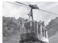
▲ 寒霞渓ロープウェイ