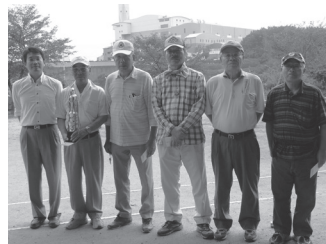
男性入賞者の皆さん