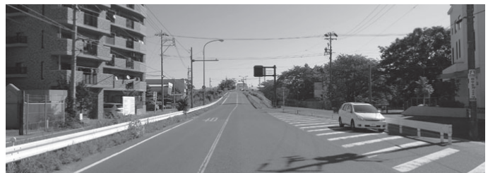
県道則定豊田線 日之出町1丁目交差点から高橋方面を望む

久保町2丁目交差点から寺部町の市道豊田北高線まで、約800mの区間で、4車線化を計画。用地取得率は98%。高橋は、H25年度より道路改良とあわせて、橋梁工事に着手する予定です。