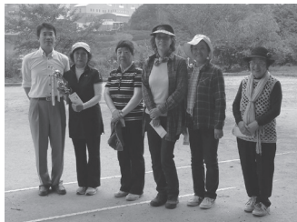
女性入賞者の皆さん