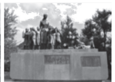
▲ 二十四の瞳 平和の群像