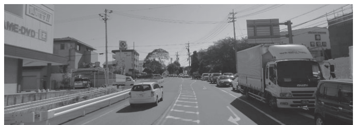
国道301号線 野見小西交差点から東を望む

内・外環状線につながる野見小西交差点から泉町2丁目交差点間、1,290mを4車線化する工事を進めています。用地取得率はH23年度末で50%。24年度中に神池郵便局前の交差点改良工事を予定しています。