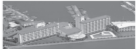
▲ 小豆島国際ホテル