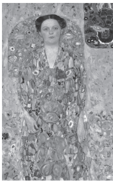
オイゲニア・プリマフェージの肖像 取得価格:18億8,275万円