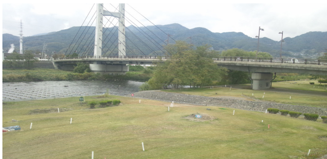
河川敷に整備された長野市菅裾花マレットゴルフ場

本市では、河川敷公園にマレットゴルフ場は整備されていない。しかし、私が調査した長野市では、河川敷公園を有効に活用したマレットゴルフ場が7か所ある。本市でも河川敷公園でのマレットゴルフ場設置は可能か。