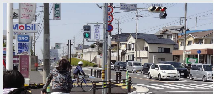
子どもたちも安心して渡れます