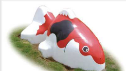
アニマル遊具(金魚)