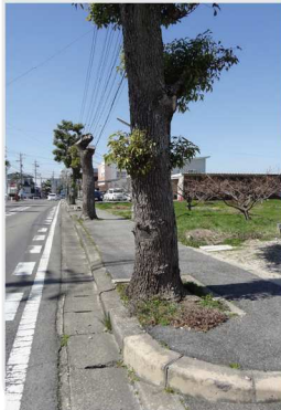
大木化し、枝払いされた街路樹

植樹帯は、道路構造令などで規定されている。しかし、街路樹が大きくなりすぎて、歩行者等の妨げになっている市道もある。市は、植樹帯をどのように整備しようと考えているのか。おいでんバス東環状線の路線にもなっている美里地区の市道東部33号線など、街路樹が大木化し、歩行者の妨げになっている歩道の適切な改修を求める。