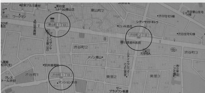
信号が変わった東山小・広川台小周辺の3か所

3月6日より、美里地区内において歩車分離式の信号機が設置され、交差点の信号サイクルが変更されました。歩車分離型の交差点になったのは、 東山町1丁目 、 渋谷町1丁目 、 渋谷町2丁目 の3か所。これは、すべての車両用信号を赤にして、すべての歩行者用信号を青にして歩行者を横断させる方法です。これにより右左折車による横断歩行者の事故が減少するとのデータもあります。ドライバーも歩行者も自転車も確実に信号が変わってから通行してください。