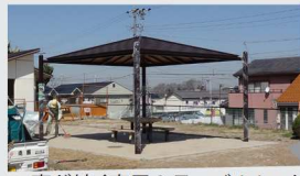
工事が続く東屋&テーブルセット