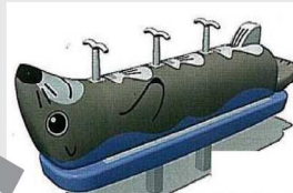
ロッキング遊具(ラッコ)