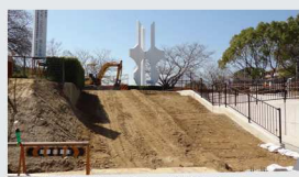
高齢者にやさしい階段&スロープ

平成24、25年度の地域予算提案事業として神池公園の再整備が進み、秋のふれあいフェスタ(交流館祭)開催までの完成を目指しています。