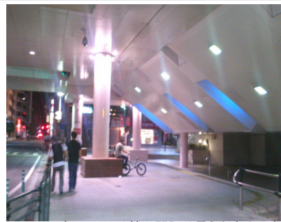
7月2日夜、この日は特に問題は見られなかった

ちなみに市役所へはこの部署に相談されましたか?もう少し市役所の対応の仕方はあったと思います。市条例については、私なりに研究してみます。