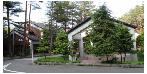
穂高温泉郷に設置されている市民山の家リゾート安曇野

テーマ選定理由：豊田市は、長野県安曇野市穂高に豊田市民山の家リゾート安曇野(客室22室、定員100名)を平成2年にオープンし、市民に利用されている。現在は、平成25年度末までを契約期間として、民間企業が、施設の管理運営を行っている。夏休み、秋の行楽シーズンは95%を超える高い稼働率で、休前日や繁忙期には、予約したくてもなかなか予約できない市民が多い。私は、同じ経費でより多くの市民が、楽しめる保養施設のあり方を提言し、その実現を求め、質問した。