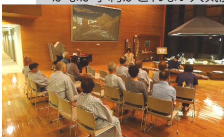
リゾート安曇野で琴の演奏を楽しむ利用者

施設の利用者数は、平成23年度が15,719人、22年度は15,463人。これらを人口42万2,000人で割れば、それぞれ3.72%と3.66%という状況。本施設は休前日、繁忙期には、なかなか予約がとれない人気施設である。これ