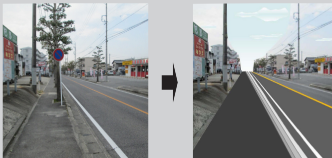
「美里1丁目」バス停付近の現状 / 街路樹伐採と歩道拡幅、車道を底上げする予定

歩道の街路樹が大木化し、通りにくくなっているエディオン美里店から外環状線までの間(市道東部33号線)の街路樹伐採と歩道拡幅工事が決定しました。平成26年度は測量設計費750万円が計上されました。平成32年頃を完成目標に順次整備します。