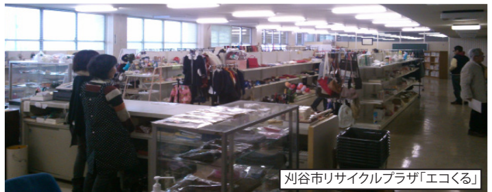
刈谷市リサイクルプラザ「エコくる」

テーマ選定理由:ごみ減量のための本市の直近の取組としては、リユース工房が、試行期間を経て平成26年4月から正式な事業になるなど、新たな取組もしている。しかし、他市では、豊田市では導入されていない様々な取組をしている。そこで他市で取り組まれている先進事例を紹介し、今回は、主に衣服やくつ等に着眼した提案を行い、市の見解を問うた。