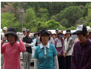
女性入賞者の皆さん