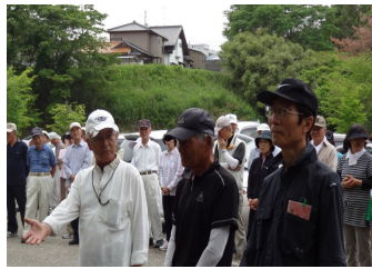
男性入賞者の皆さん