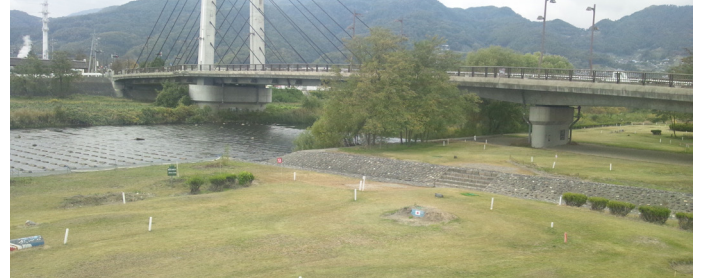
河川敷に整備された長野市宮宿花マレットゴルフ場

市営マレットゴルフ場は今後、移転、拡充を除いて、新設する予定はない。本市の河川敷公園は、河川管理者から占用許可を得て設置している。マレットゴルフ場として活用することも可能と考えている。ただし、河川敷公園をマレットゴルフ場に改変する場合は、河川管理者と設置物の構造や管理方法を協議する必要がある。