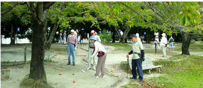
近隣公園である神池公園には駐車場がないが、遠方からの利用者も多い

500m圏内の住民を主な利用対象とする近隣公園のなかに、遠距離からの利用者が多い公園もある。しかし、駐車場は整備されていない。利用状況、周辺環境によっては、近隣公園に対する駐車場の整備や他の公設駐車場の有効活用も必要だと考える。市の所見、今後の方針は。