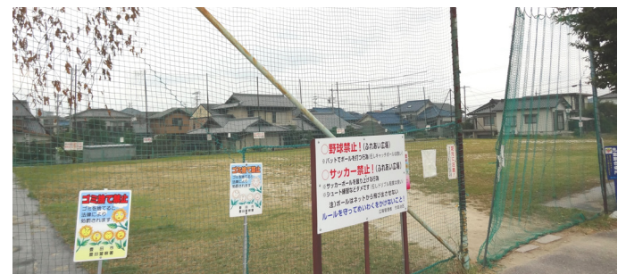
惜しまれながらH26年度に廃止された今町ふれあい広場

地域広場設置要綱では、10年以上借地した広場など、要件を満たせば買収する場合もあるが、買収基準の厳しさや重要性の判断等により、H16年以降、買収していない。用地取得は、緑の基本計画に位置付けられ、都市公園の配置上必要な土地であれば、都市公園事業として買収する可能性もある。これらの判断は現在の組織体制で対応することが可能で、地域広場整備基金や審査会の設置は不要と考える。