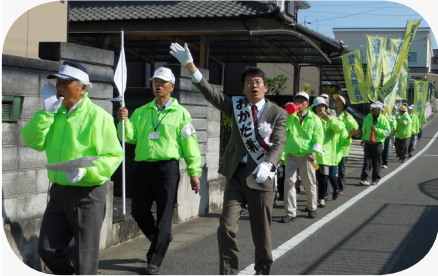
多くの皆さんと桃太郎行列