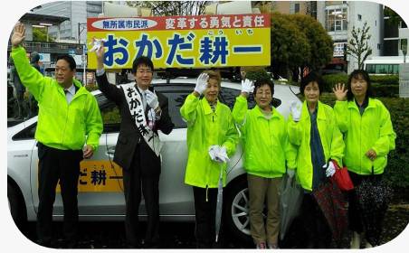
うぐいす嬢の皆さんと街頭活動