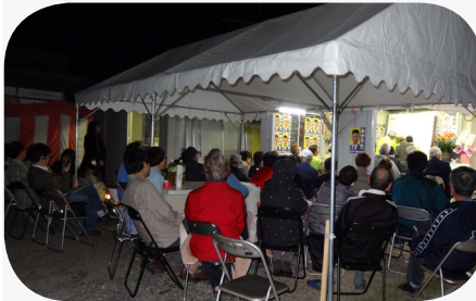
開票を待つ皆さん。寒くても熱気いっぱい