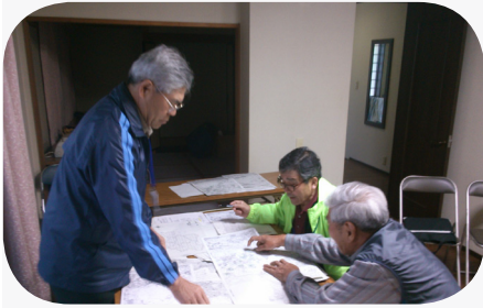
ポスター掲示の割り振りも大変です