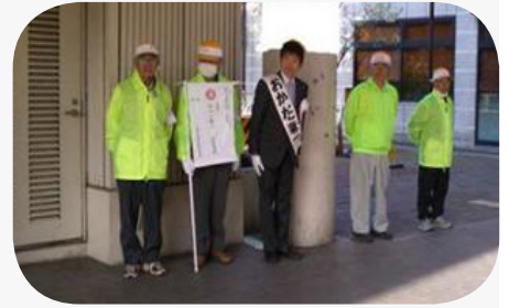
豊田市駅前にて朝の街頭活動