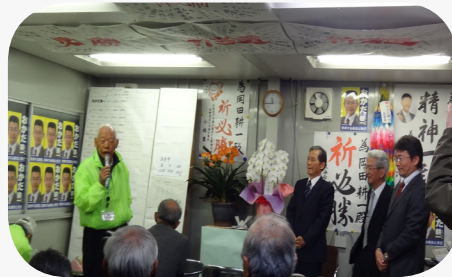
23時30分過ぎ、事務局長より当選確実の報告