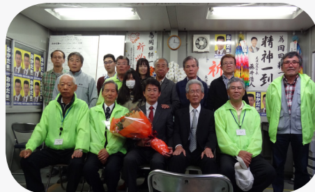
選対本部スタッフ