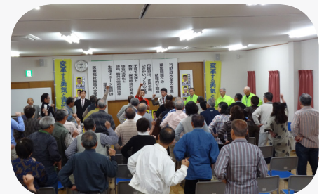
満員の個人演説会での頑張ろう三唱