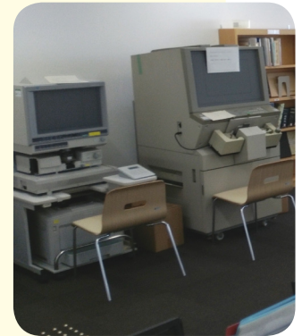
公文書管理センターにはマイクロフィルム読み取り機があるが、公文書が保存されていなければ、無用の長物だ

この文書は本当にどこにもないのか。 その当時なら、文書作成ソフト等で作成し、紙資料とデジタルデータの両方あるはずだ。原本がなくてもコピーやマイクロフィルム、録音データを含むデジタルデータとして全く保存されていないのか。 本当はないのなら、誤廃棄された理由と想定される経緯は。