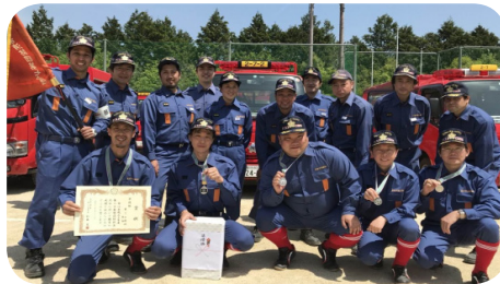
第3分団1,2部合同チーム1点差の準優勝!