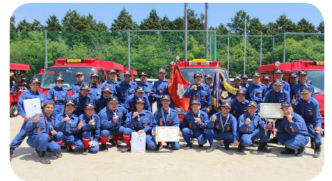
第3分団3部(益富地区)チームが見事優勝!写真は第3分団

豊田市消防団では、市内全域で団員を随時募集しています。ご関心のある方は下記までお願いします