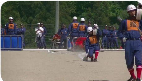
第3分団1,2部合同チーム(美里地区)の小型ポンプ操法