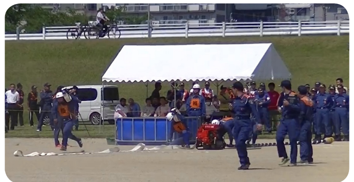
準優勝した第2方面隊第3分団チームの小型ポンプ操法