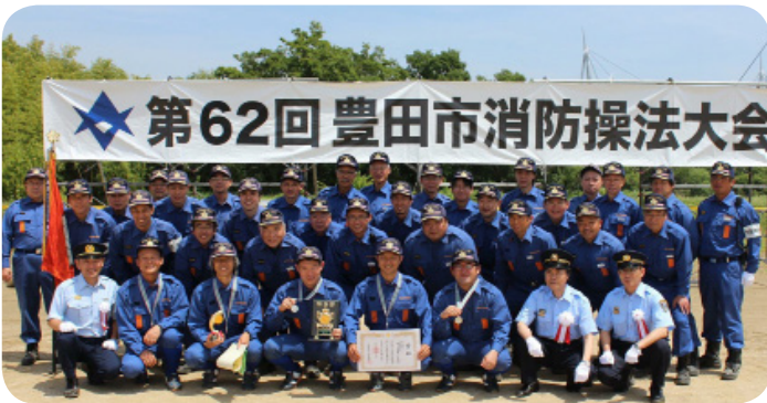
豊田市消防操法大会で第2方面隊第3分団チームは惜しくも1.5点差で準優勝!