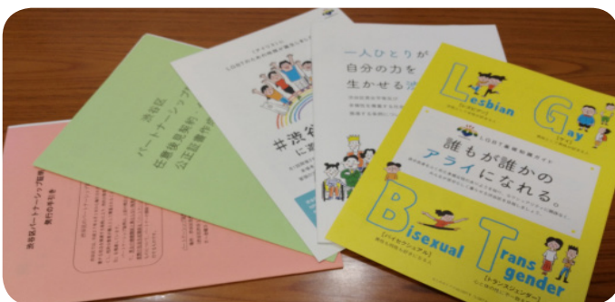
渋谷区が発行するLGBTに関する各種冊子等