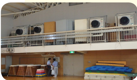
区立小学校体育館に導入されたスポットエアコン

しかし、体育館への設置はいまだに方針が出ていない。災害時に避難所となる学校体育館にはスポットクーラー等の空調設備を導入すべきだ。