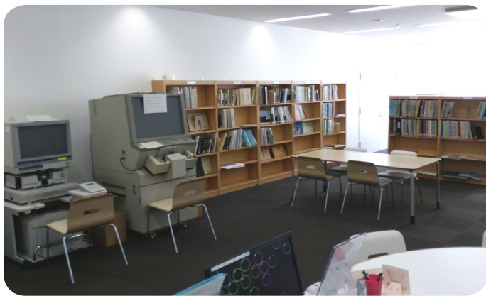
東庁舎7階の公文書管理センターにはマイクロフィルム読み取り機(写真左端)があるが、公文書が保存されていなければ、無用の長物だ

農業委員会の議事録はマイクロフィルム化し、フィルム自体を原本として保存する。紛失した文書は、他のマイクロフィルムにも含まれておらず、作成に用いた文書データも、削除しており発見できなかった。マイクロフィルム化した後は、原文書を廃棄することとしており、マイクロフィルム化の時点で5か月分の議事録が欠落していたことに気づかず、原文書を廃棄してしまったと想定。