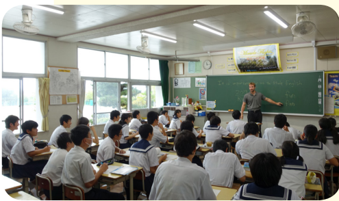
扇風機は設置されているが、暑い教室 平成28年10月撮影

そして、本年7月、市内の小1男児が、校外授業後に熱中症で亡くなられた。私は当時も今も市教育委員会として統一かつ具体的な指針を設けるべきと考えている。本市の見解、対応は。