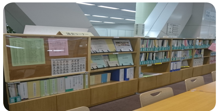
過去の開示資料が撤去された南庁舎1階の市政情報コーナー

過去の開示資料は、公文書管理センターの閲覧スペースで簡単に閲覧できるようにすべきだ。また、市政情報コーナーには、過去の開示資料の目録・一覧を設置し、これらのウェブサイトへの公開を求める。