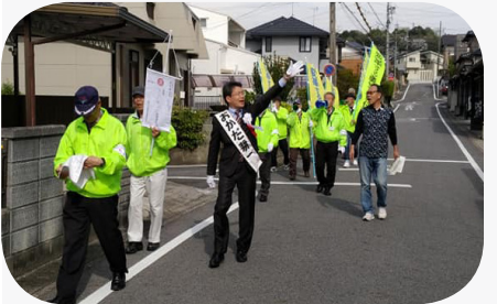
多くの皆さんと元気よく桃太郎行列