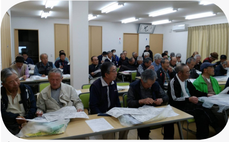
ポスター掲示説明会には多数の方にご参加いただきました