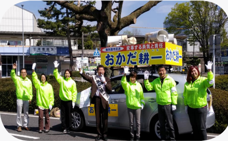
スタッフの皆さんと街頭活動(三河豊田駅前)