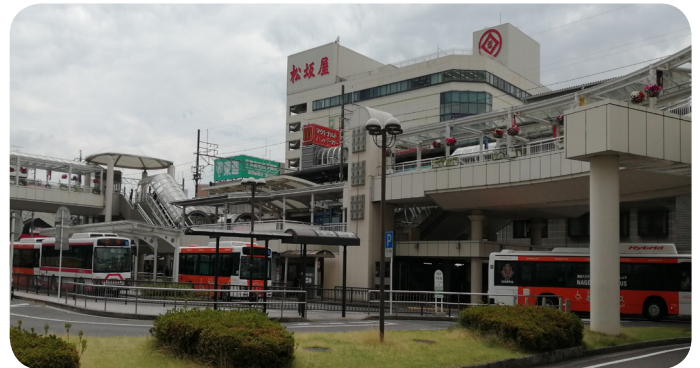
免許証自主返納促進には、路線バスの利便性向上と負担軽減が望まれる

これらの事業化を期待する。高齢者の運転免許証の自主返納を増やすための市の取り組み、今後の展開を問う。