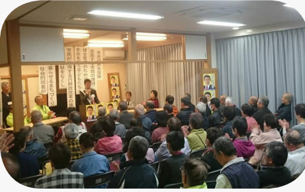
熱気に包まれる個人演説会場