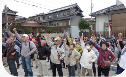
力をあわせて頑張ろう！