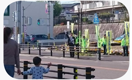
小さなお子さんの声援も受けて