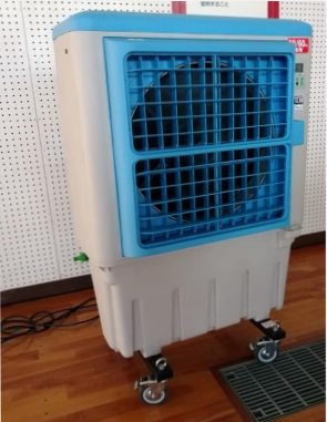
移動式の大型冷風扇

結果、本年3月末までに市内の全小中学校の体育館に大きさに応じて2～4台(計324台)の大型冷風扇(7万円/台)の導入が完了した。