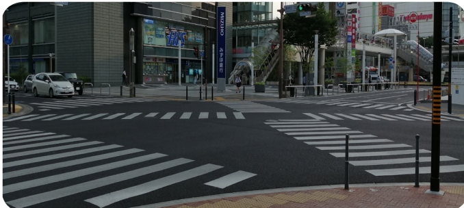
市駅前のスクランブル交差点。車両の暴走をこのポールで防ぐことができるのか？

本市では、交差点の歩道側には防護柵が設置されていると理解するが、未整備箇所はあるのか。市の把握状況と、今後の整備の考えを問う。