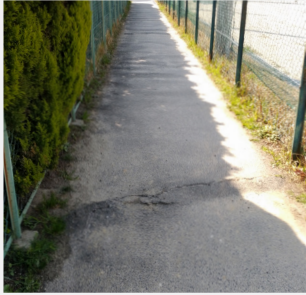
豊田東丘幼稚園西側通路

結果、本年3月末までに運動広場の周回通路すべてが透水性のアスファルト舗装に改修され、気持ちよく安心して歩けるようになった。