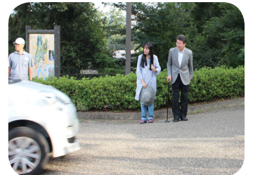
次回もお待ちしています