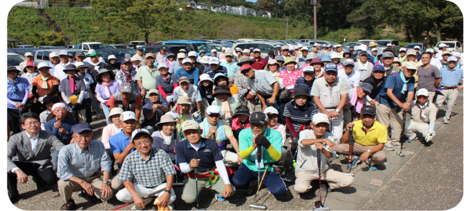
150名を超える参加者、スタッフの皆様、ありがとうございました