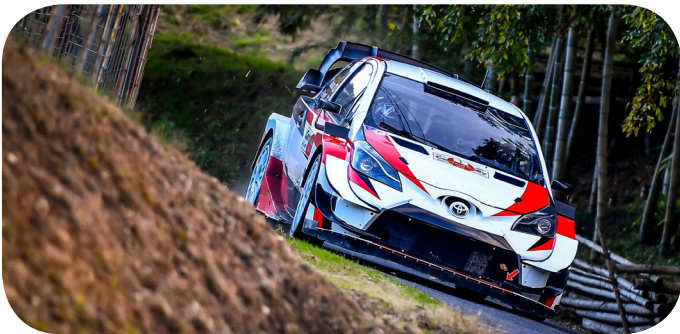
WRC世界ラリー選手権日本ラウンドでは豊田市内も会場となる。こちらも楽しみだ

本市の豊かな自然や、定住につながる内容、ラリーの魅力などが盛り込まれる。全国公開により、本市の魅力在全国に発信する効果が大きいと判断する。作品の聖地化による経済波及効果などを期待し、出資金予算(3,250万円)を妥当と認める。