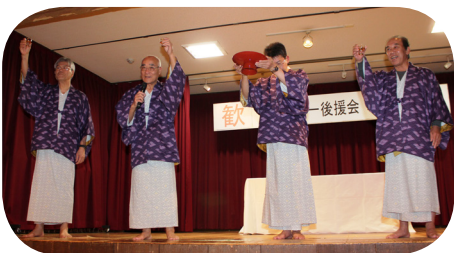
皆様のご健勝、ご多幸を祈念して乾杯!!