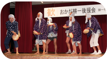
楽しく踊る皆さん