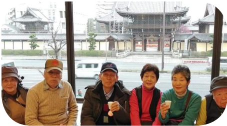
興正寺をバックに漬物を試食