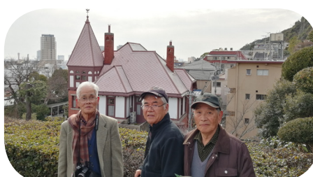
神戸・異人館を散策