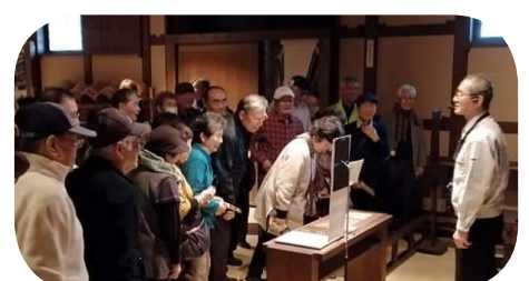
試飲が待ち遠しい菊正宗の工場見学