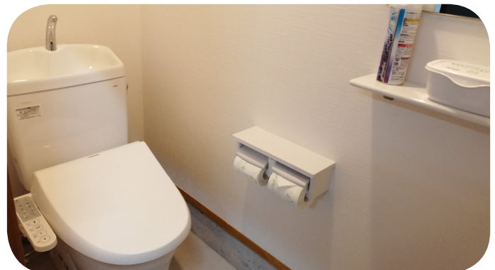
移転新築された古瀬問詰所のトイレ。女性団員の在籍詰所にも早期改修を期待