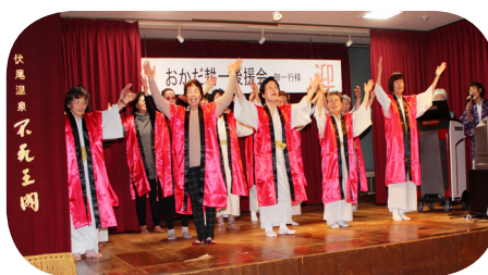
楽しく踊る皆さん