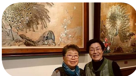
きれいな刺繍をバックに