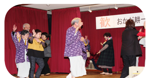
楽しく踊る皆さん