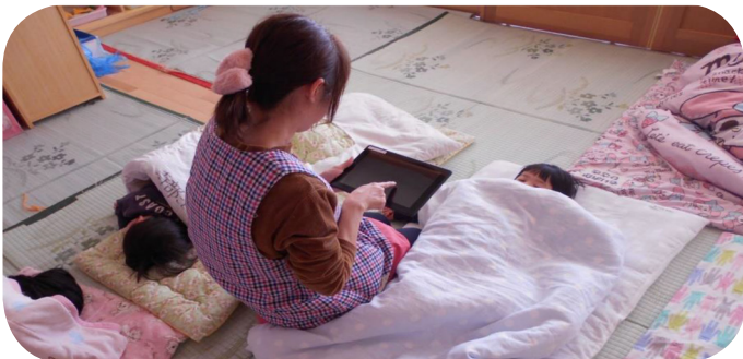
こども園へのタブレット端末導入により保育士の負担軽減が期待できる

具体的には、試行において有効性を確認した「園児基本情報管理」、「登降園管理」、「保護者連絡」の各機能が活用できるタブレット端末を本格導入するもの。