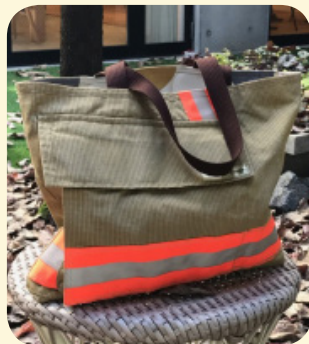
消防防火衣リメイクバック