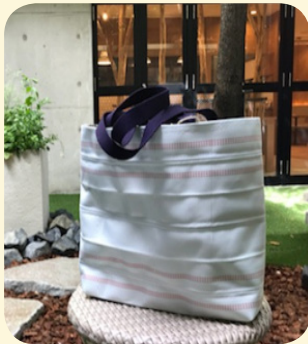
消防ホースリメイクバック