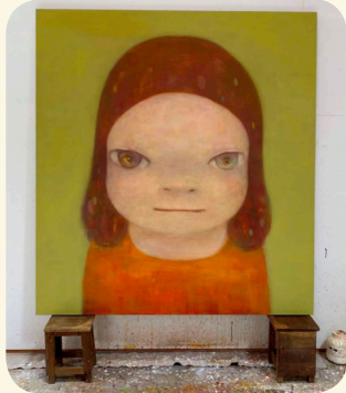
「Through the Break in the Rain」 制作2020年 2.2m×1.95m

※ 議案名はわかりやすく表示しています。議員名は敬称略、発言順に記載。会派名は順に日本共産党豊田市議団(諸派)、豊田市議会自民クラブ議員団、豊田市議会市民フォーラム、公明党豊田市議団、とよた市民の会(諸派)、心が聴こえる市政の会。 ○は討論せずに賛成。×は討論せずに反対