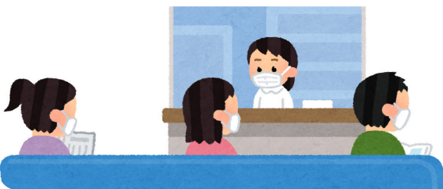
コロナ禍で医療機関の経営も厳しいという。医療が崩壊すれば市民の命が守れない

本市の公共施設の使用料は、施設の維持管理費等から設定し、利用可能人数によるものではないので、 現時点では、公共施設の使用料を減免する考えはない。