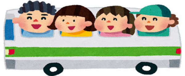
今年の修学旅行は小中ともに日帰りだが、楽しい旅行にしてほしい

今回の一般質問でも多くの議員が本感染症に関連した質問をしており、重複しない分野について質問した。本紙では、各種支援策の考え方を記載。