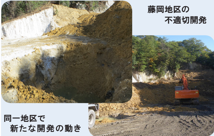
藤岡地区の 不適切開発