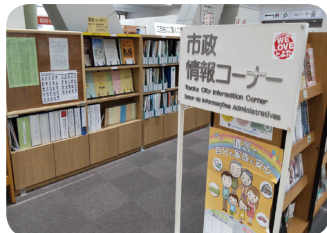
詳細は南庁舎1階 市政情報コーナーで閲覧可

※ いずれの会派も残金は市に返納。コロナ禍により県外出張を伴う視察・研修等の自粛により大幅に活動を制限し予算執行した