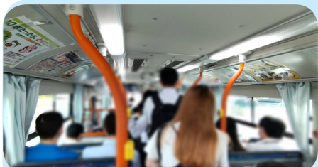
9月27日(火)7時40分頃。東口臨時バス停着