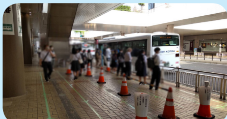
9月27日(火)8時頃。西口バスターミナル