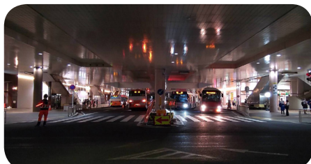
9月25日(日)18時45分頃。西口バスターミナル