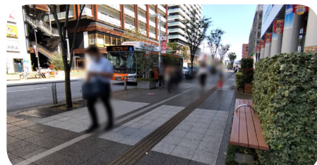
9月30日(金)12時30分頃。東口臨時バス停