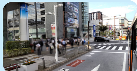
臨時バス停で降車した乗客は豊田市駅方面へ