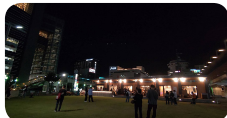
9月25日(日)19時頃。東口の芝生広場