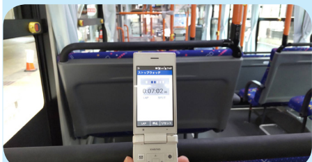
東口臨時バス停から西口には7分余分に乗車