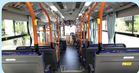
東口臨時バス停。おかだ市議以外、全員下車