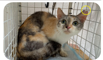
耳のカットは避妊去勢手術をしてあるという印

動物愛護センターは既存施設を改修し整備しており、 施設的な制限があることは認識しており、運用面を工夫し対応する。ただし、今のところ改修予定はない。