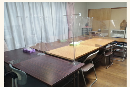
感染症対策した事務所で対応いたします