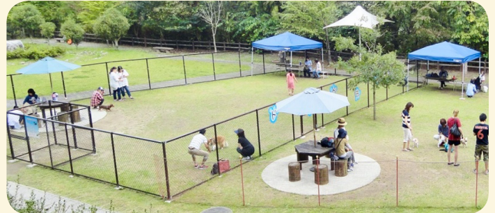
香恋の館に併設するドッグラン。

さまざまな余暇、ペットとのふれあいがあるなかで、ドッグランの誘致や市による整備も検討すべき課題だと思います。また、毘森公園の再整備計画が不透明ななかで、 暫定的な利用や再整備計画にドッグラン整備を織り込むことも十分可能だと思います。 しかし、記載のように 有料民間施設があるなかで、市営の無料施設整備は民業圧迫につながらないか判断が難しいところ です。今後、市担当課とともに調査、研究いたしますのでお時間ください。