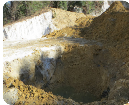
藤岡地区における 不適切開発

取り上げた理由: 藤岡地区において無農薬農園造成事業と称して多くの建設残土を搬入、乱開発した案件があった。県の指導によりやっと是正し事業中止されたが、同一地区で再び開発の動きがある。今後、不適切開発が繰り返されない方策を求め質問した。