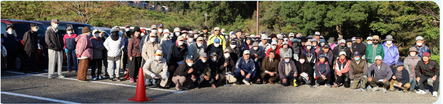
100名を超える参加者、スタッフの皆さん、ありがとうございました