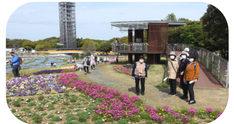
浜名湖花博2024会場にて