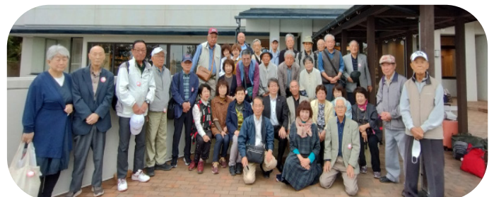
ホテル前で参加者の皆さんと