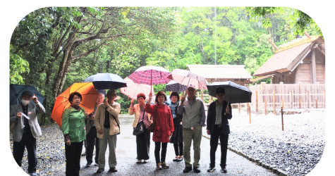
雨の中、伊雑宮(志摩国一宮)参拝