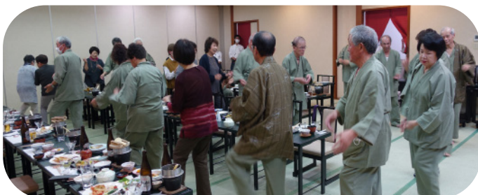
宴会場で楽しく輪になる