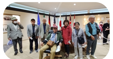
伊勢志摩サミット館にて首脳になった気分で