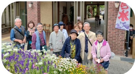
イングリッシュガーデン入口にて