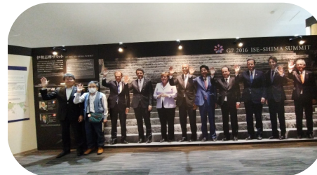
G7の首脳の皆さんと