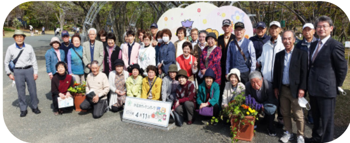
浜名湖花博2024会場（2号車の皆さん）