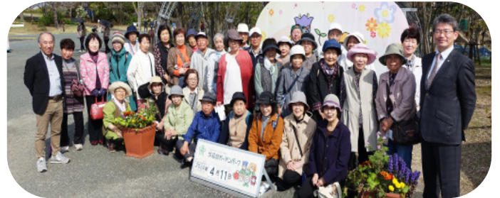
浜名湖花博2024会場（1号車の皆さん）