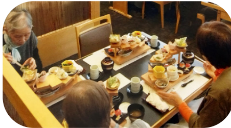
ホテルのレストランで腹ごしらえ