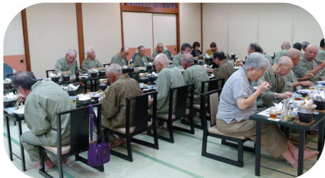
宴会場で海の幸を堪能