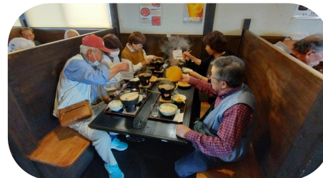
松阪牛に舌鼓をうつ