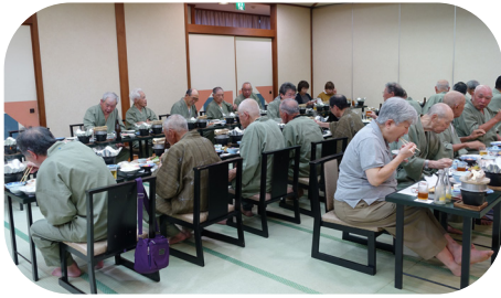
宴会場で海の幸を堪能