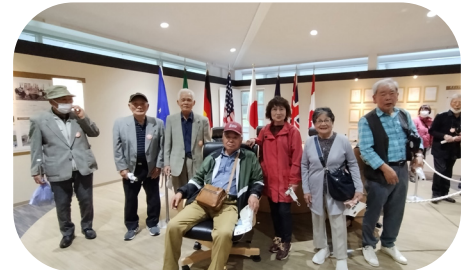
伊勢志摩サミット館にて首脳になった気分で