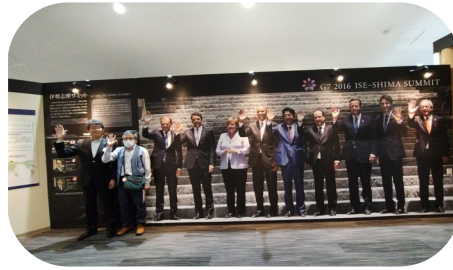
G7の首脳の皆さんと