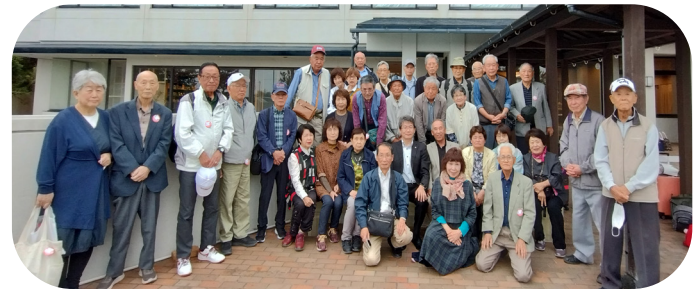
ホテル前で参加者の皆さんと