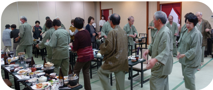
宴会場で楽しく輪になる