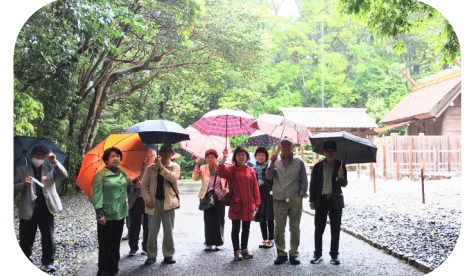
雨の中、伊雑宮(志摩国一宮)参拝