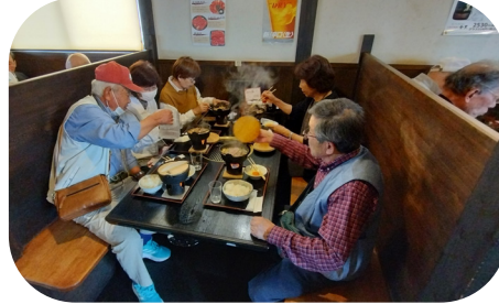
松阪牛に舌鼓をうつ