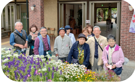
イングリッシュガーデン入口にて