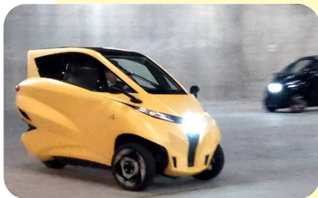
1人乗りの超小型モビリティ・Lean3

いくことに不安を覚える。この3社を含め、本市企業に対する今後を見据えた取組、対応は。