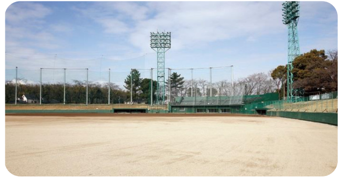
毘森公園の中心施設である野球場

中央公園の整備が進むなか、毘森公園の再整備にも市民の大きな期待がかかる。そして、毘森公園に隣接していたキューピー挙母工場は操業停止後、今は更地となり、不動産会社「日本エスコン」により取得され、今後の開発が注目される。市民の参画の考え方を含め、今後の毘森公園の再整備について問う。