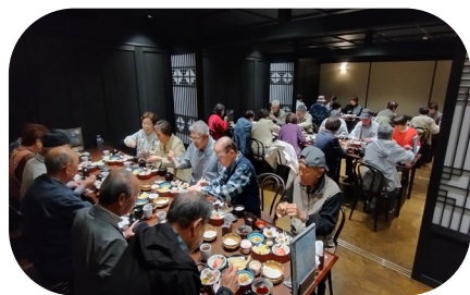
おいしいランチを堪能