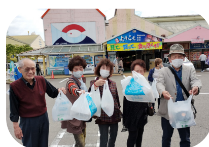
焼津さかなセンターでたくさんの買い物