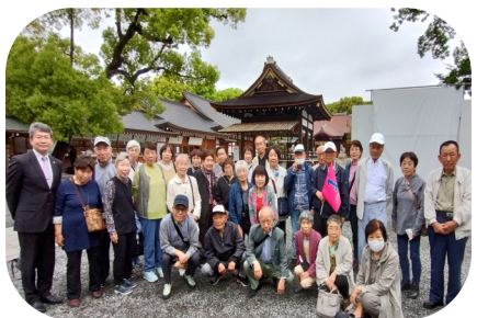
城南寺にて(1号車の皆さんと)