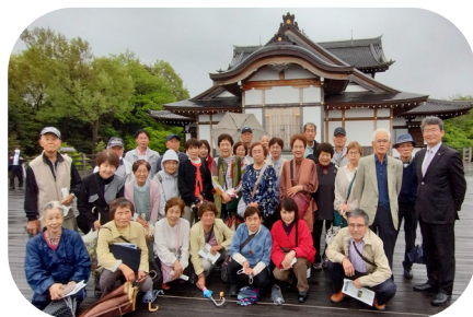
将軍塚青龍殿にて(2号車の皆さんと)