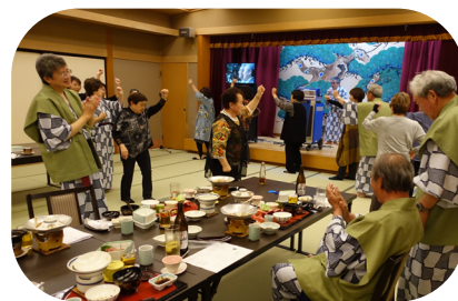
宴会場で輪になって