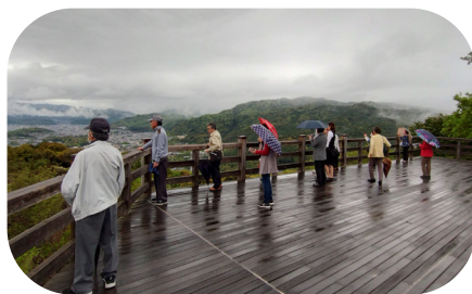
将軍塚青龍殿の舞台から眼下を眺める