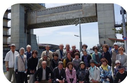
大型展望水門「びゅうお」前で