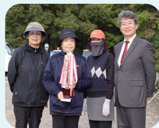
女性入賞者の皆さん