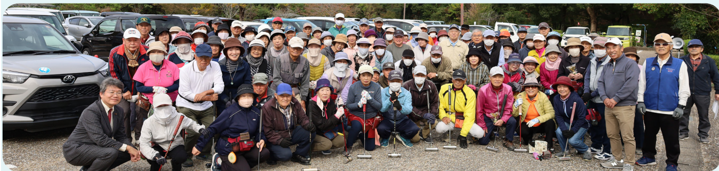
参加者の皆さん、スタッフの皆さん、ありがとうございました