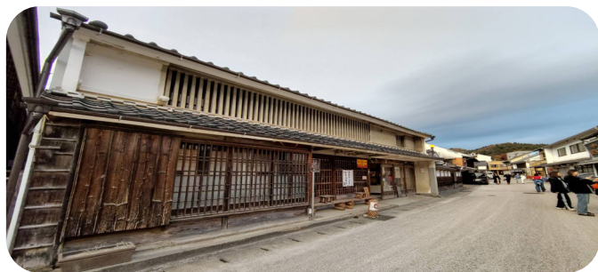
足助の重要伝統的建造物群保存地区の中心にある旧田口家住宅

文化庁の「 文化資源活用事業費補助金 」や内閣府の「 新しい地方経済・生活環境創生交付金 」の活用を想定し、 補助率は2分の1を見込む 。