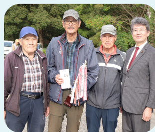
男性入賞者の皆さん