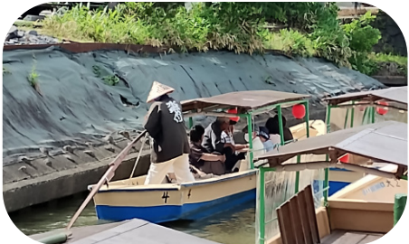
近江八幡市の水郷めぐり