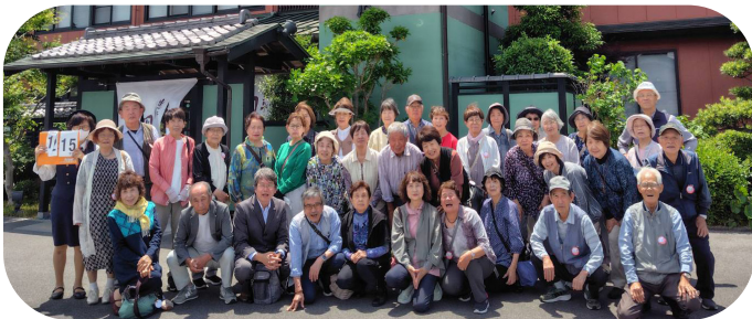
近江牛 岡喜本店にて(2号車の皆さんと)