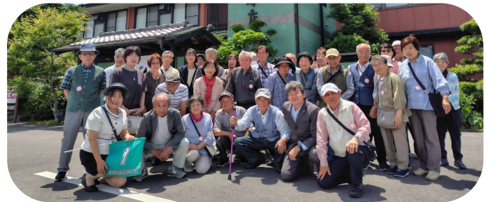
近江牛 岡喜本店にて(1号車の皆さんと)