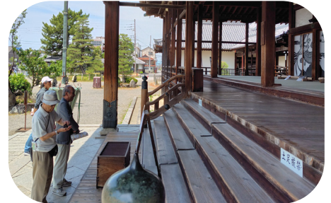
長浜別院大通寺参拝