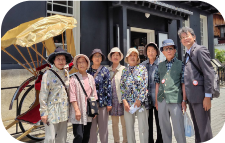
長浜・黒壁スクエア散策