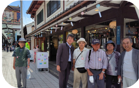
長浜・黒壁スクエア散策