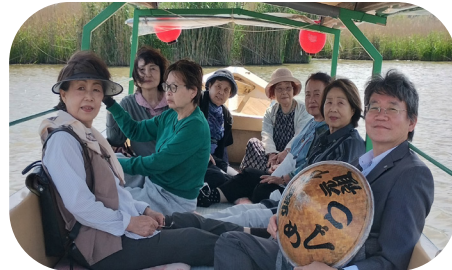
水郷めぐりのひとこま